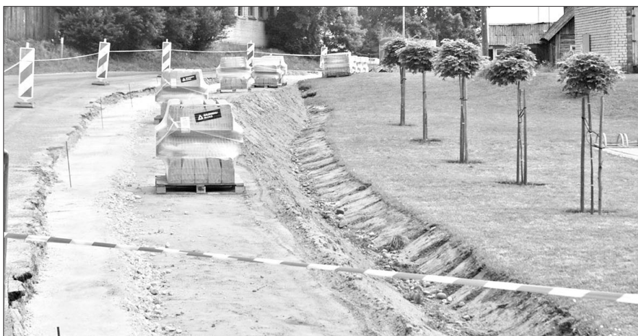
IETVE BŪS GARĀKA un arī gājējiem drošāka.